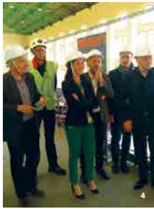
Le Club de l'Économie La Provence